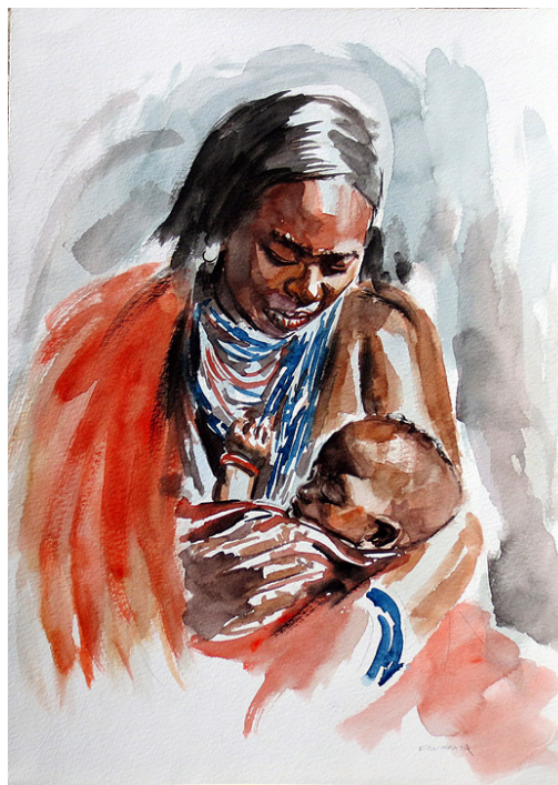
Бака са бебом Слика Патрика Кинутије