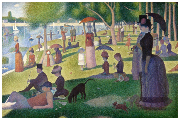
Недељно поподне на острву Ла Гранде Јатте Слика Жоржа Серата